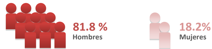
Datos: Página electrónica de la SCJN.