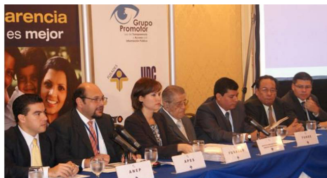
Figura 4: Conferencia organizada por el Grupo Promotor de la Ley de Transparencia y Acceso a la Información Pública para subrayar la necesidad de adoptar la Ley de Acceso a la Información en El Salvador.

Grupo Promotor de la Ley de Transparencia y Acceso a la Información Pública: esta red apoyó la aprobación de la Ley de Acceso a la Información en El Salvador y desde entonces ha monitoreado activamente su cumplimiento.