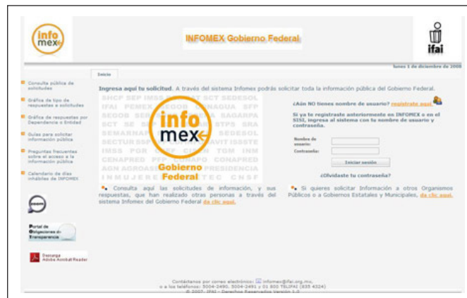
Figura 3: La plataforma Infomex en México

La mayoría de las solicitudes de información enviadas a las instituciones públicas federales (489.739 en México en el periodo 2003-2009; 13.017 en Chile en el periodo 2009-2011) se enviaron a través de estos sistemas informáticos.